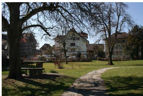
Platz für einen altersgerechten Begegnungsort