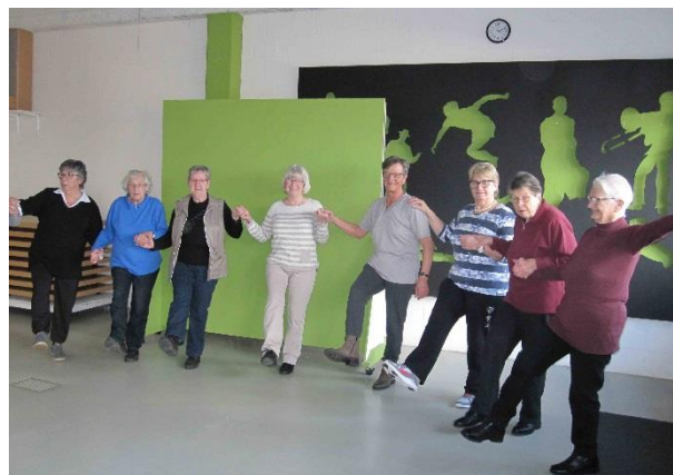
Fasnacht und Bewegung im Altersturnen