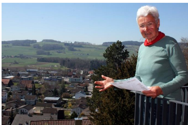
Triengen hat viel Lebensqualität zu bieten

In einem Schreiben an die Bauherrschaft hat die Projektgruppe darum gebeten, beim Ausbau der wichtigsten Ladenlokalitäten im Dorf ein öffentliches WC einzuplanen. Die Rückmeldung stimmt uns positiv, eine konkrete Zusage gibt es noch nicht. Viele Anliegen brauchen noch ihre Zeit. Notwendig ist immer wieder ein öffentliches Nachhacken, damit die wertvolle Arbeit nicht einfach in der Schublade verschwindet und vergessen wird.